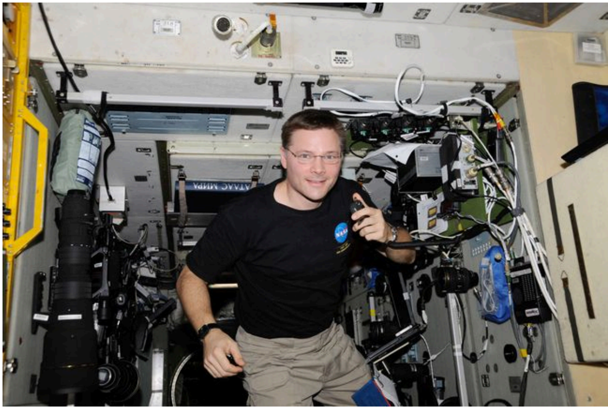
Krótkofalowiec Doug Wheelock na Międzynarodowej Stacji Kosmicznej

Wkrótce gdy powstały pierwsze komercyjne stacje radiowe i biznesmeni zainteresowali się radiem, przywłaszczyli sobie oni cały zakres fal długich i średnich, o których wtedy sądzono że jako jedyne nadają się do komunikacji na dalekie odległości. Ponieważ nikt z biznesmenów nie był zainteresowany wykorzystaniem fal krótkich, ani tym bardziej kolejnych zakresów jeszcze krótszych fal, te części spektrum elektromagnetycznego pozostawione zostały krótkofalowcom. Stąd właśnie wzięła się nazwa tego hobby.